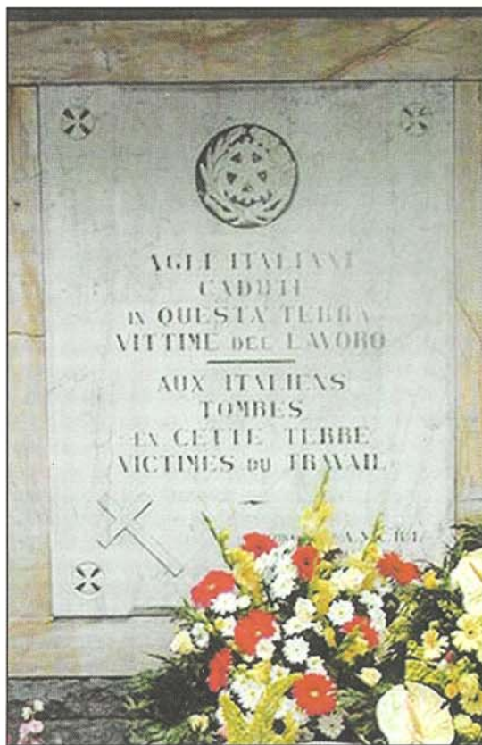
La lapide nel cimitero di Marcinelle a ricordo dei 136 italiani periti e, in basso, il ministro Tremaglia, durante la cerimonia al cimitero di Marcinelle, si intrattiene con alcuni ex minatori; sotto, propaganda per il reclutamento affissa negli uffici di collocamento italiani

Sta mentendo a se stesso; in realtà non è mai partito per non lasciarli soli, i suoi camarades , per tanti anni dimenticati da tutti, mai da lui e neanche da quel