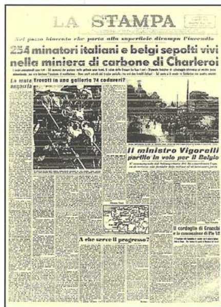
La prima pagina de La Stampa del 9 agosto 1946, che dava la notizia della tragedia; in alto, il cancello d'ingresso alla miniera di Marcinelle, tanto simile a quelli di un campo di concentramento

to nella terra, molti anni dopo, il mostro di Marcinelle, Marc Dutroux (venne arrestato nel 1996) faceva morire di fame le bambine dopo averle rapite e seviziate.